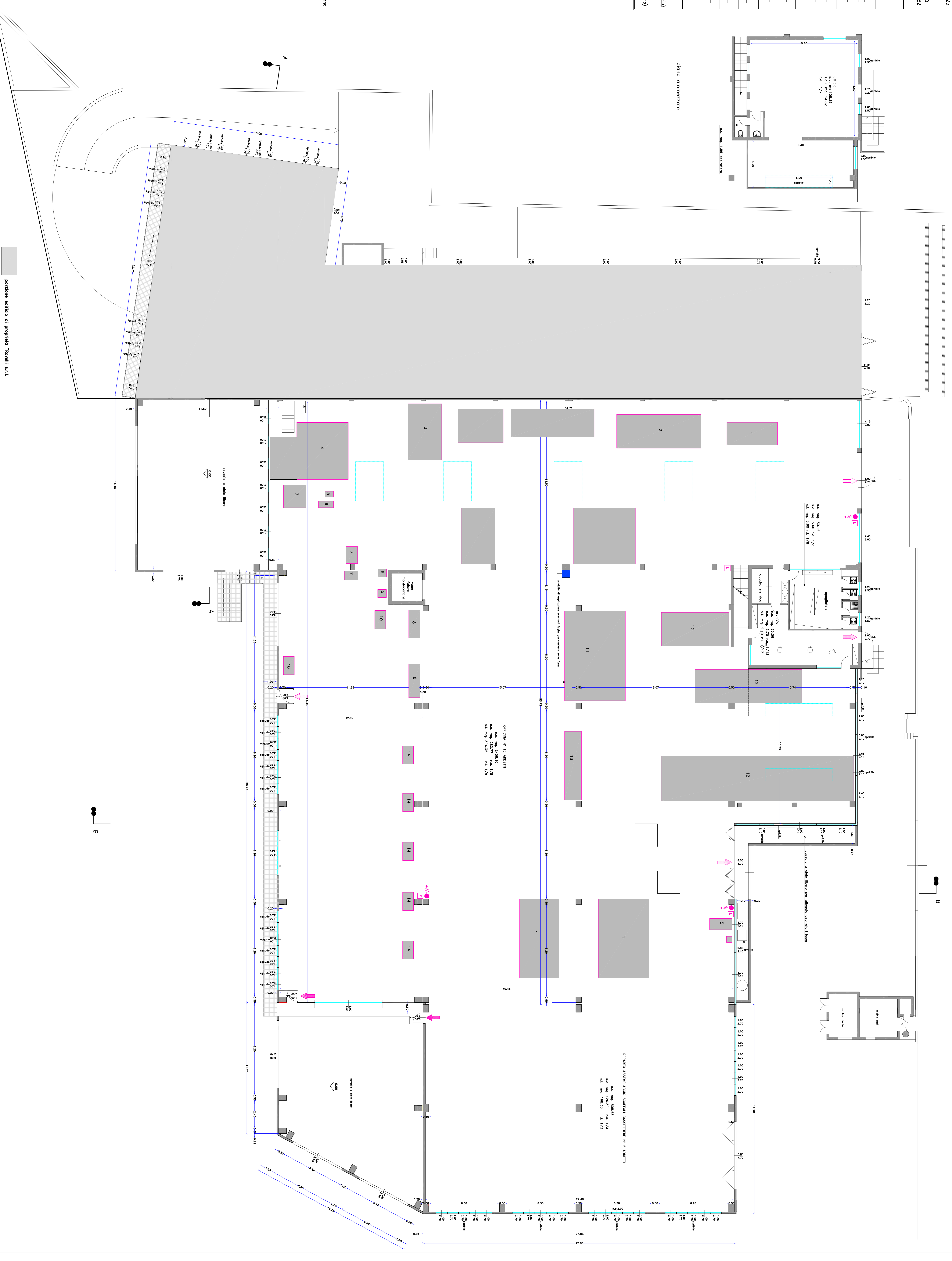
portione edificio di proprietà 'Novelli s.r.l.

REPARTO ASSAMBLADGIO SCARFILI-CASSETTIERE N° 2 ADETTI