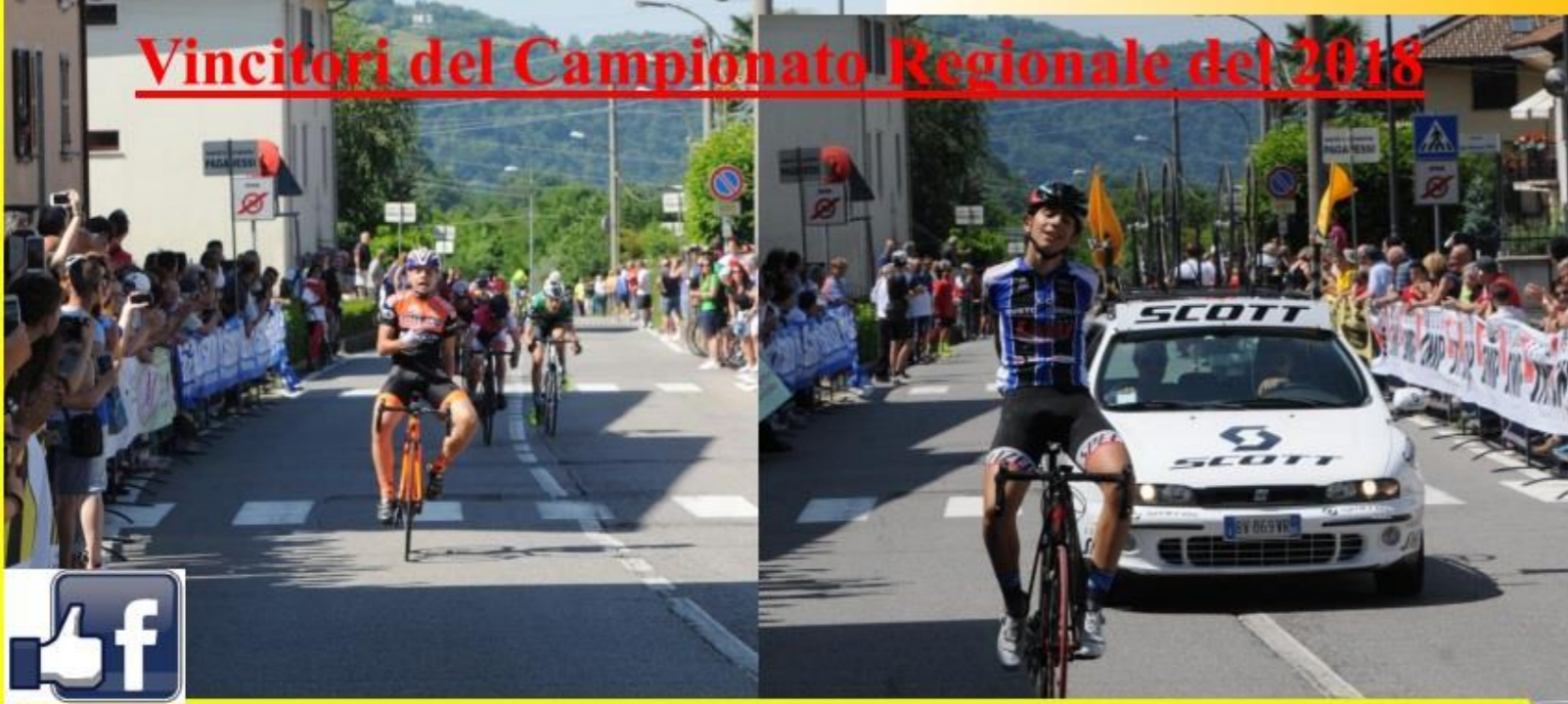
Vincitori del Campionato Regionale del 2018